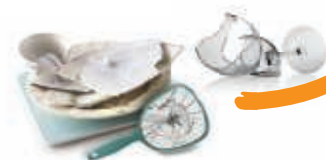
Le verre et la vaisselle cassés