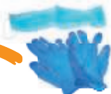
Les masques et les gants jetables