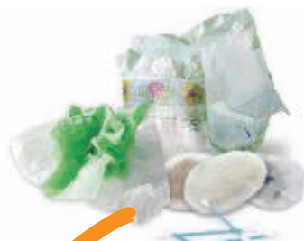
Les déchets d'hygiène et couches jetables