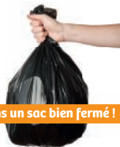
Et toujours dans un sac bien fermé !