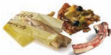
Les restes alimentaires